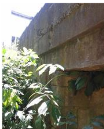
Názov: II 526-8 Okolie mosta