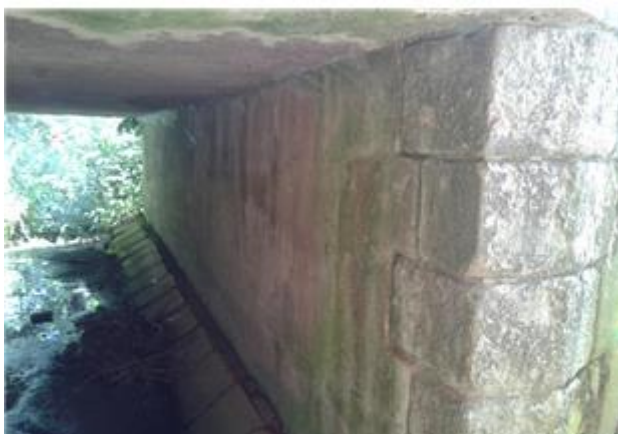
Názov: II 526-8 Senohrad (8).jpg