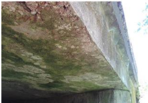
Názov: II 526-8 Podhľad NK