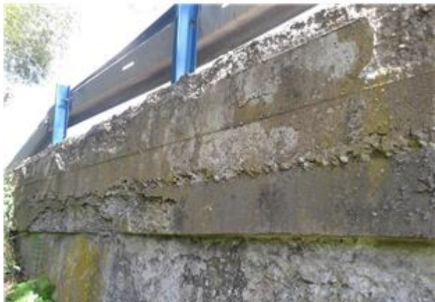
Názov: II 526-8 Senohrad (10).jpg