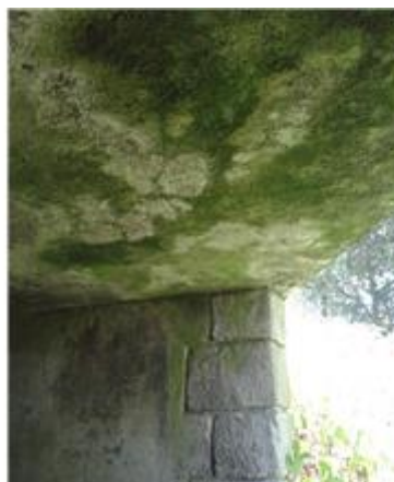
Názov: II 526-8 Podhľad NK