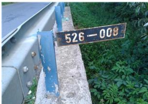
Názov: II 526-8 Rímsa