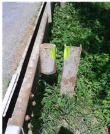
Názov: II 526-8 Zvodidlo