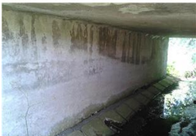
Názov: II 526-8 Prídlažba