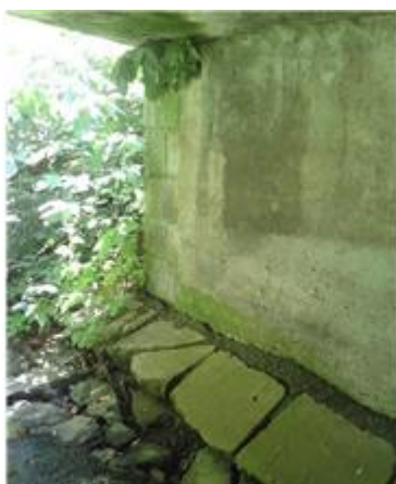
Názov: II 526-8 Senohrad (16).jpg