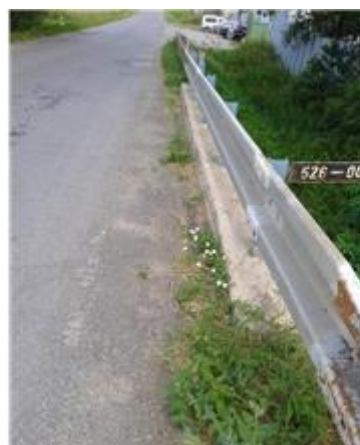
Názov: II 526-8 Vozovka