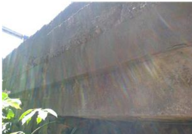
Názov: II 526-8 Senohrad (20).jpg