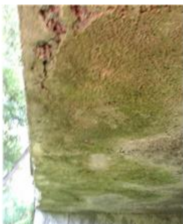
Názov: II 526-8 Senohrad (12).jpg