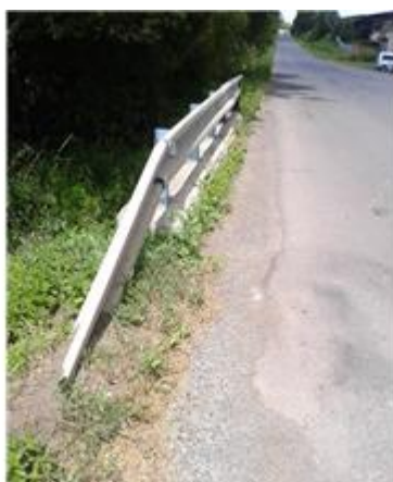
Názov: II 526-8 Vozovka