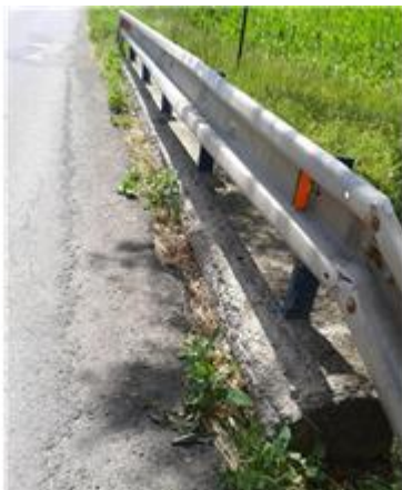
Názov: II 526-8 Vozovka