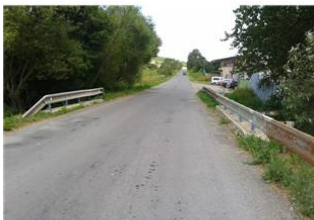
Názov: II 526-8 Vozovka