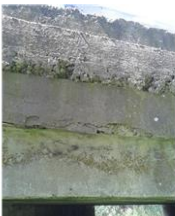
Názov: II 526-8 Senohrad (21).jpg