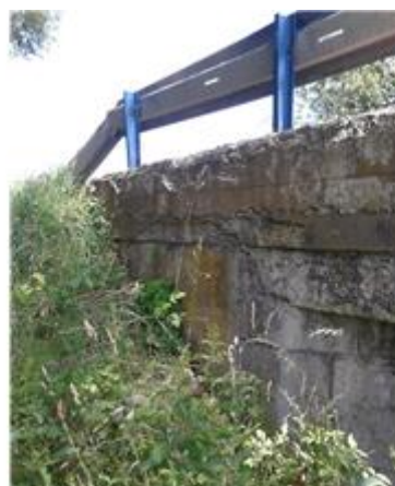
Názov: II 526-8 Senohrad (7).jpg