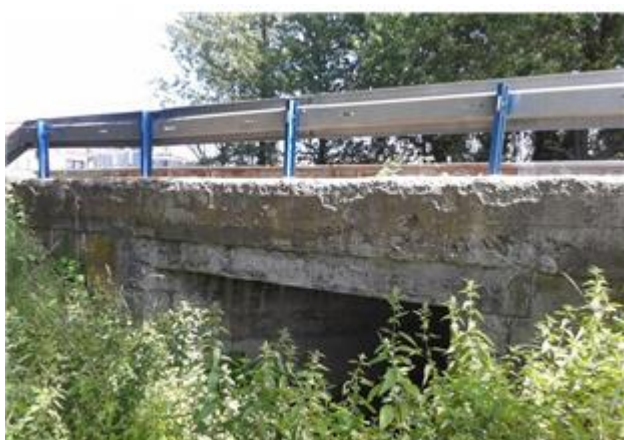
Názov: II 526-8 Rímsa