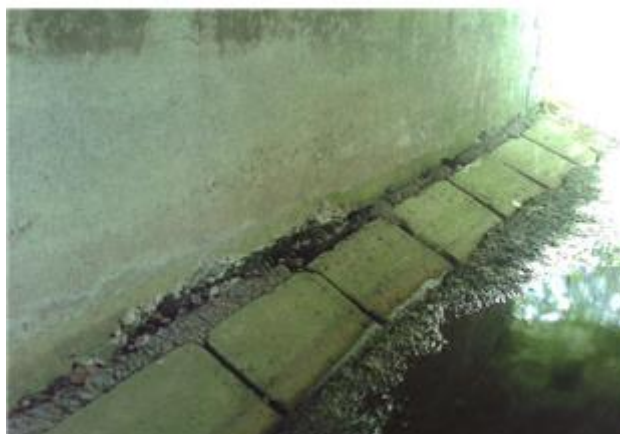
Názov: II 526-8 Driek opory