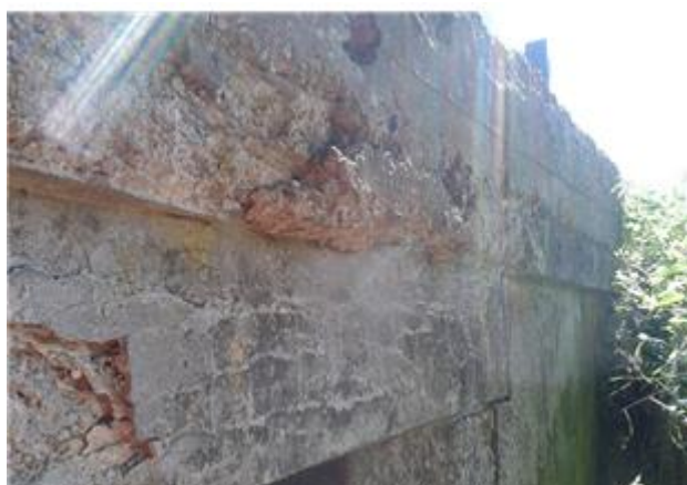
Názov: II 526-8 Rímsa a nosná konštrukcia