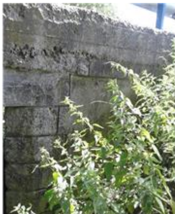
Názov: II 526-8 Okolie mosta