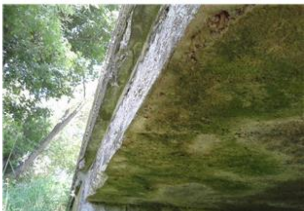
Názov: II 526-8 Senohrad (13).jpg