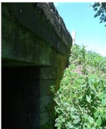
Názov: II 526-8 Okolie mosta